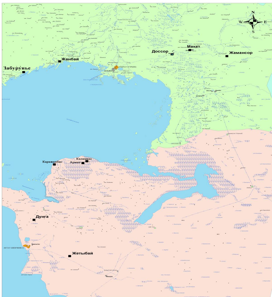
Рис.1.1. Схема расположения месторождений наблюдения за состоянием атмосферного воздуха и почвы в пределах Среднего и Северного Каспия

Состояние загрязнения воздуха оценивается по результатам анализа и обработки проб воздуха, отобранных на стационарных постах наблюдений. Основными критериями качества являются значения предельно допустимых концентраций (ПДК) загрязняющих веществ в воздухе населенных мест (Приложение 1).